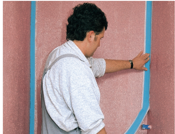
PCI Pecitape asennetaan tuoreeseen PCI Lastogum vedeneristeeseen.